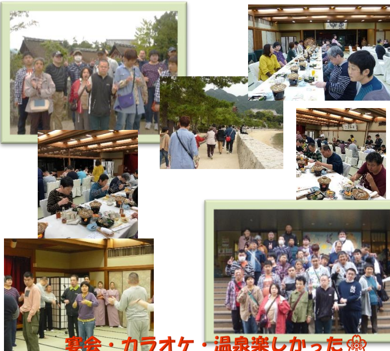
宴会・カラオケ・温泉楽しかった

〒799-2407 松山市下難波乙 145-13 TEL089-993-3359 FAX089-993-3551