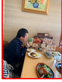
ガストに行ってきました！

一月二十六日のフリーデーでは、外食に行きました。昼食の時間までは少し時間があつたので、カラオケをしましたが、自分の時間を過ごしたりして過ごしました。毎度のことですが、皆さんのカラオケ好きと歌唱力にはいつも圧倒されます。気持ちよく歌ったり、曲に合わせて踊ったりと楽しく過ごしました。 そろそろお腹が空いたかな……。の音が聞こえ始めたので、今回は和食、洋食、中華の班に分かれ、各バスに乗って出発!!土曜日だったので、少し混雑していましたが、三班に分かれての外出だったので焦らずゆとりとした雰囲気、自分の選んだメニューを堪能することが出来ました。 園に帰ってきてからは、「この店が美味しかった」、「ボリュームがあつて最高!」、「また行きたい!!」などお互いの店の情報交換をするなど、皆さんとても楽しんでいただいた様子でした。