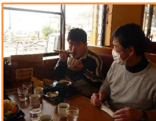
道の駅ふわりに行ってきました！