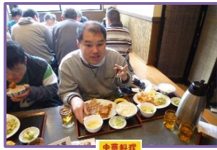
北京飯店に行ってきました！