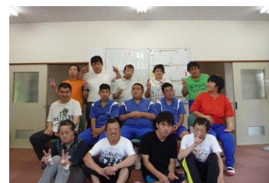
実習、おつかれさまでした♪

六月十五日から二十八日の十日間、今治特別支援学校から男性三名、女性一名、計四名の実習生が来られました。朝はラジオ体操、トレーニングから始まります。最初は緊張した面持ちでしたが、そこはあかつきの先輩方！休み時間にはいろいろ話をして緊張をほぐしていました。二日目には笑顔も見られていました。 音楽療法やクラブ活動にも参加しました。いつもと違う活動でしたが、楽しんでいる様子が見られていました。あつという間の実習期間でした。お別れするのは少し寂しい気持ちもありますが、学校に帰っても頑張ってくださいね！！