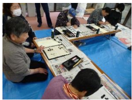
真剣な眼差です・・・