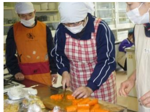
だれが上手に切れているかな?