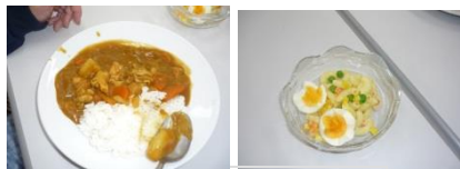
美味しくできました♪