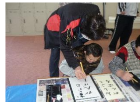
習字の授業、思い出します・・・