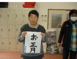
いい字が並びました♡