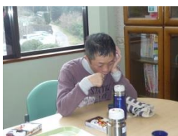
さみしくなります...