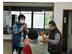
金賞おめでとうございます!