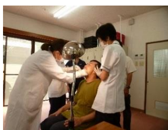
虫歯はないですか？

歯科巡回診療車「こまどり号」が今年も巡回に来てくださいます。 おなじみの歯医者さんと歯科衛生士さんたちに囲まれ、落ち着いた雰囲気の中、歯科検診とブラッシング指導が始まりました。毎日のブラッシングの成果を見ていただくいい機会です。みなさん真剣な面もちで椅子に座ります。 口を開いて「C1、C2・・・」虫歯や歯周病をチェックしていきます。 見ていただいた後はブラッシング指導です。ブラシが当たりにくい場所は角度や持ち方を工夫します。毎日のブラッシングが健康な歯と体を作っていきます。 健康的な食生活を維持するためには、八十歳になっても自分の歯を二十本以上保つことが推奨されています。しかし目標を達成している人は半数を下回っているそうです。 毎日のケアで健康な歯と歯ぐきを保ちましょう！