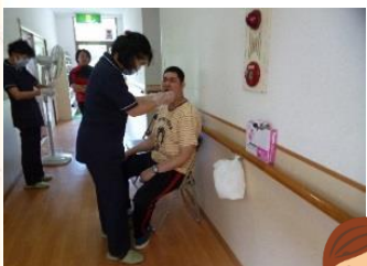
丁寧なブラッシングを心がけましょう